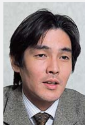
東映株式会社 情報開発室

東映では、全国に展開する7つのホテルの予約システム「joyport」をMacromedia Flash RemotingとMacromedia ColdFusion MX、クールサイトのFLASH BEAMSを使い構築した。Flashで使いやすいインタフェースを実現することで、Webブラウザの使い難さを克服。ホテルマンが使いやすい顧客管理やアンケートプロモーションの機構を実装し、CRM推進の強力なツールを手に入れた。